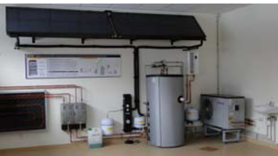
▲ Rysunek 1. Podgrzewacz Hewalex INTEGRA w układzie z kotłem wiszącym, pompą ciepła powietrze/woda oraz instalacją solarną

Kiedy warto stosować wspomaganie ogrzewania budynku? Przede wszystkim, gdy: