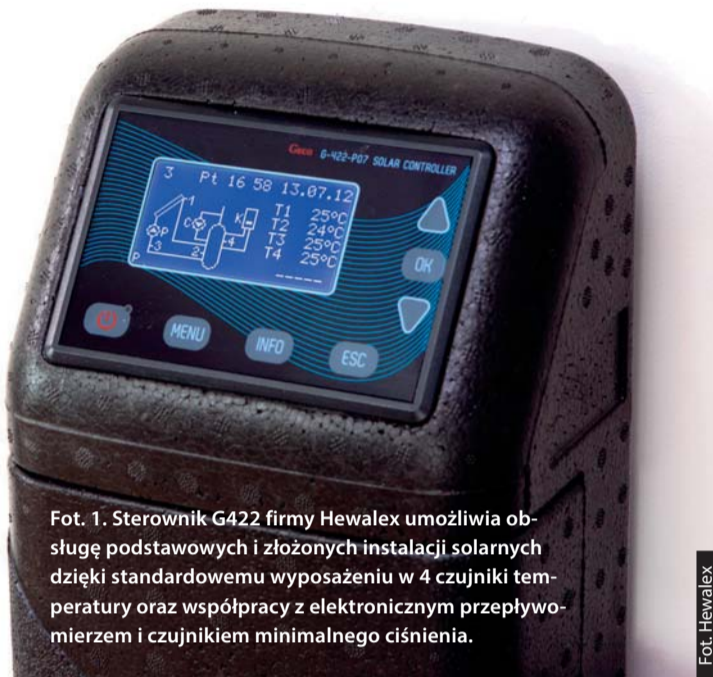
Fot. 1. Sterownik G422 firmy Hewalex umożliwia obsługę podstawowych i złożonych instalacji solarnych dzięki standardowemu wyposażeniu w 4 czujniki temperatury oraz współpracy z elektronicznym przepływomierzem i czujnikiem minimalnego ciśnienia.

Pod pojęciem inteligentnego sterowania systemem grzewczym może kryć się wiele algorytmów pracy układu automatycznej regulacji. Dotyczy ono zarówno samego urządzenia grzewczego jak i jest obsługiwane przez sterownik, jak i zarządzania pracą całego systemu.