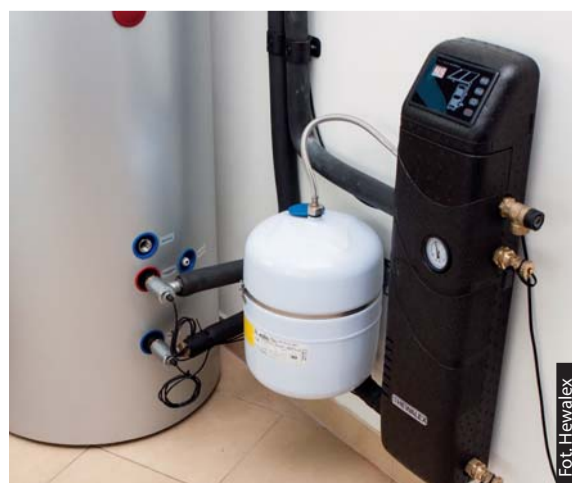
Fot. 3. Zespół Pompowo-Sterowniczy Hewalex ZPS18a-01 ze sterownikiem G425. Podłączenie zespołu ZPS do węzłownicy podgrzewacza (pompa ciepła c.w.u.: Hewalex PCWU200K-2,3kW) z tulejami do zabudowy czujników temperatury dla funkcji Opti-Flow.

Hewalex Sp. z o.o. Sp.k. 43-502 Czechowice-Dziedzice ul. Słowackiego 33 tel. 32 214 17 10, fax. 32 214 50 04 infolinia: 801 000 810 e-mail: hewalex@hewalex.pl www.hewalex.pl